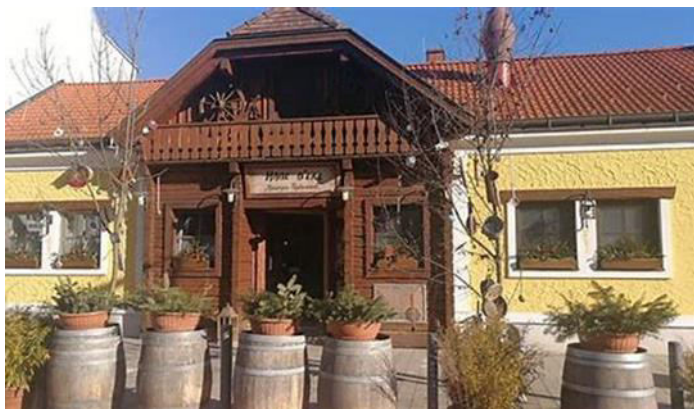
Heurigenrestaurant HABE D'ere